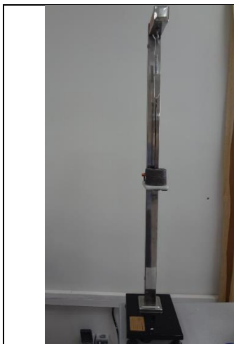
دستگاه آزمایش قانون هوک