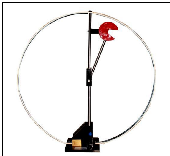
دستگاه تست ضربه شارپی