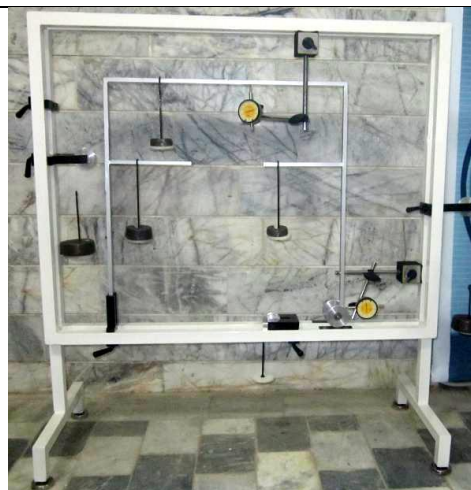
دستگاه تغییر شکل قاب