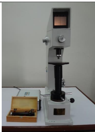
دستگاه سختی سنجی