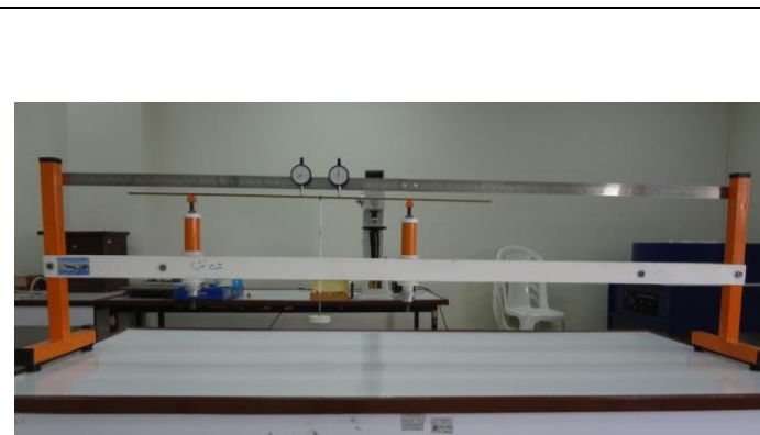
دستگاه تست خمش