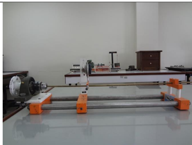
دستگاه تست پیچش