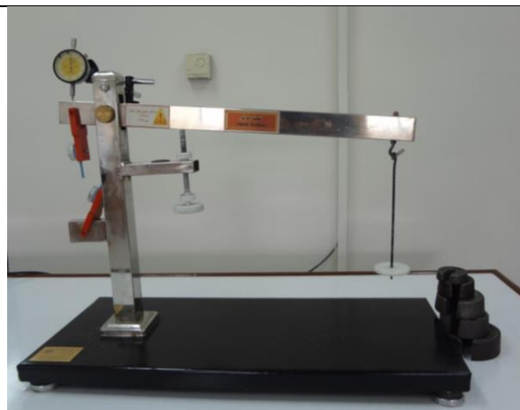
دستگاه تست خزش