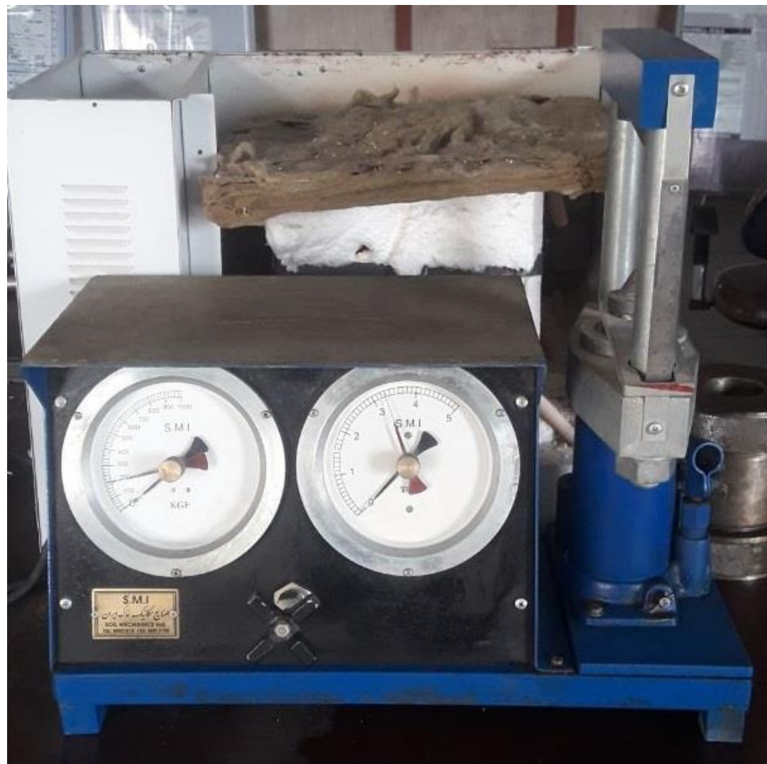
دستگاه آزمایش بار نقطه ای