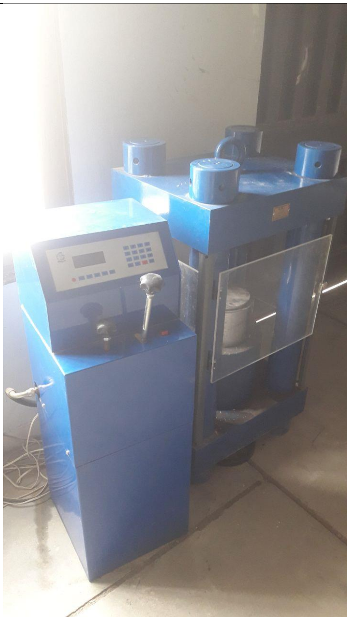
جک بتن شکن