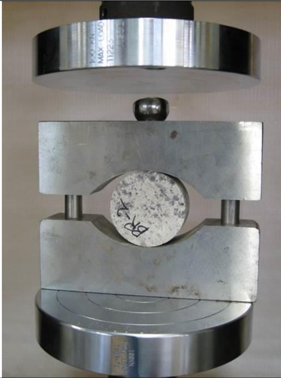
فک های آزمایش برزبلی