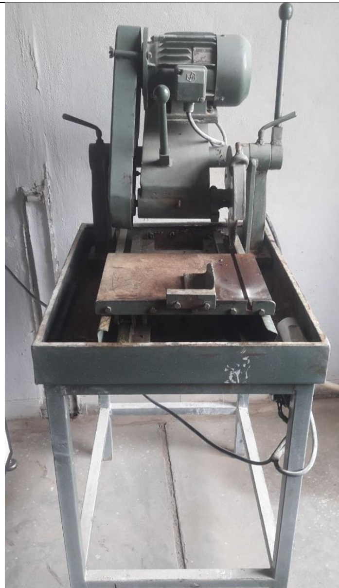
دستگاه برش مغزه و بلوک