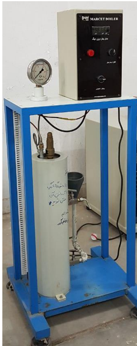
دستگاه شبیه ساز دیگ مارست