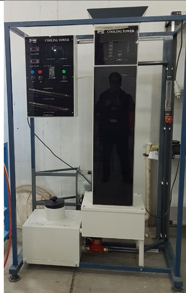
دستگاه شبیه ساز برج خنک کننده