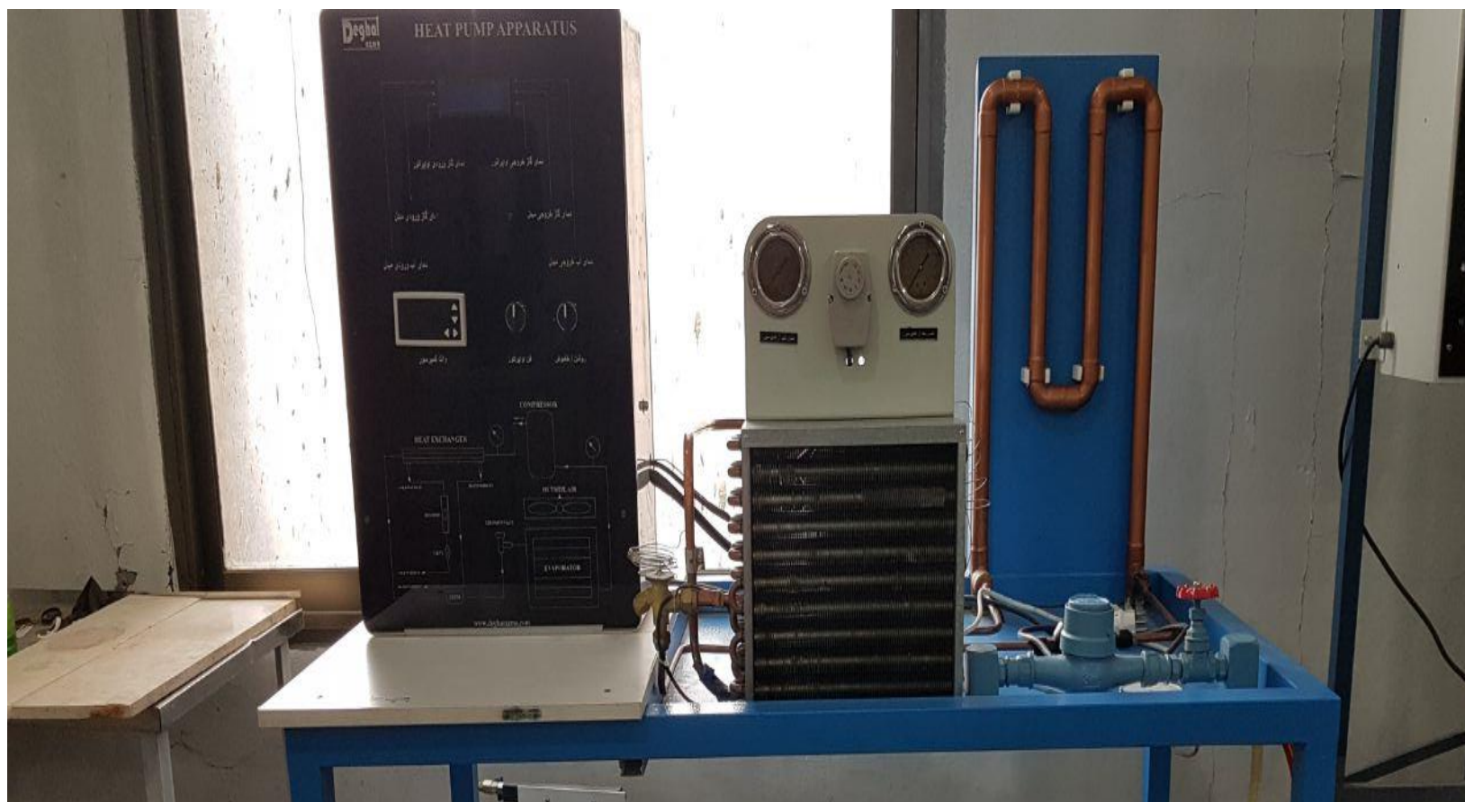
دستگاه شبیه ساز پمپ حرارتی