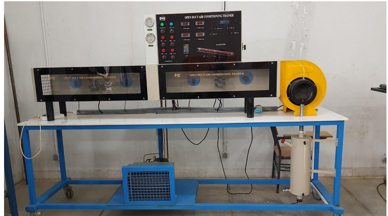
دستگاه شبیه ساز سیستم تهویه مطبوع