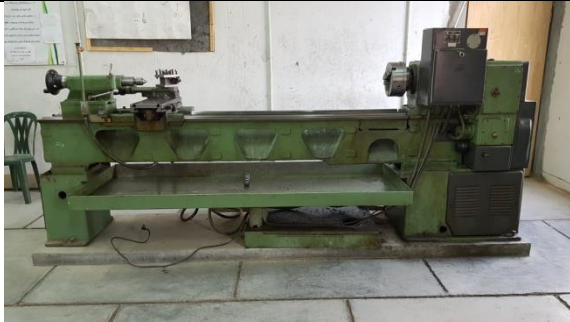
دستگاه تراش ۲/۵ متری ماشین سازی تبریز