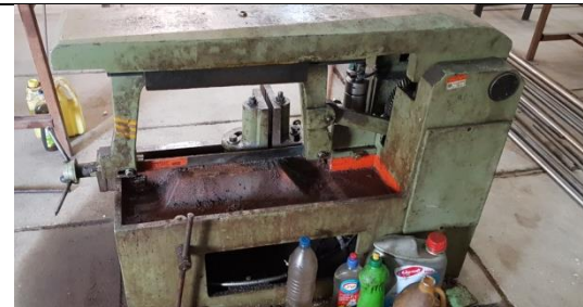
اره لنگ مستعمل