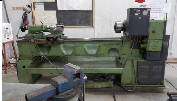
دستگاه تراش ۲ متری ماشین سازی تبریز