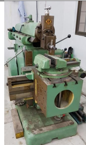
دستگاه صفحه تراش