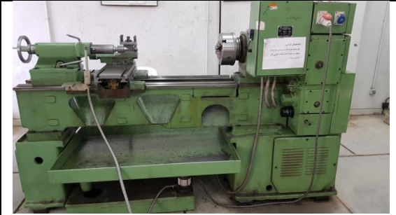
دستگاه تراش ۱/۵ متری ماشین سازی تبریز