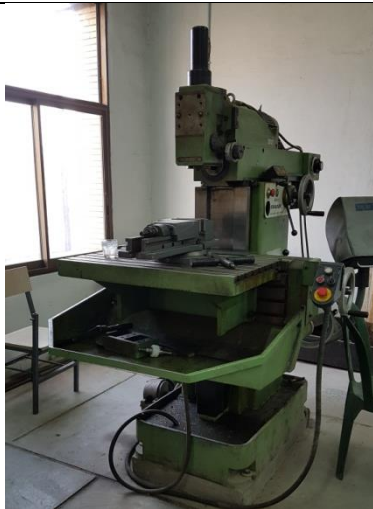
دستگاه فرز MK۴FP