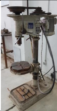
دریل ستونی مستعمل