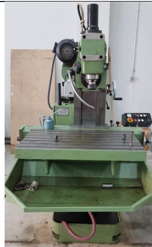
دستگاه فرز دکل تبریز