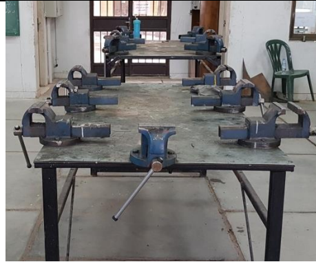
میز کار و لوازم کارگاهی