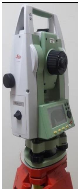
تئودولیت TS۰۲ Plus